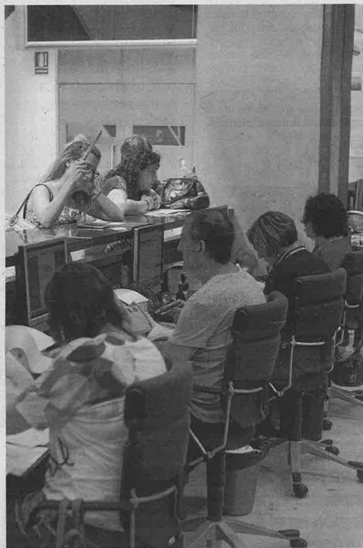
Funcionarios atienden la oficina del contribuyente, en la planta baja de la Consejería de Hacienda.

Además de estos trabajos de mantenimiento informático contratados a empresas externas, muchos de los cuales vienen incluidos en el